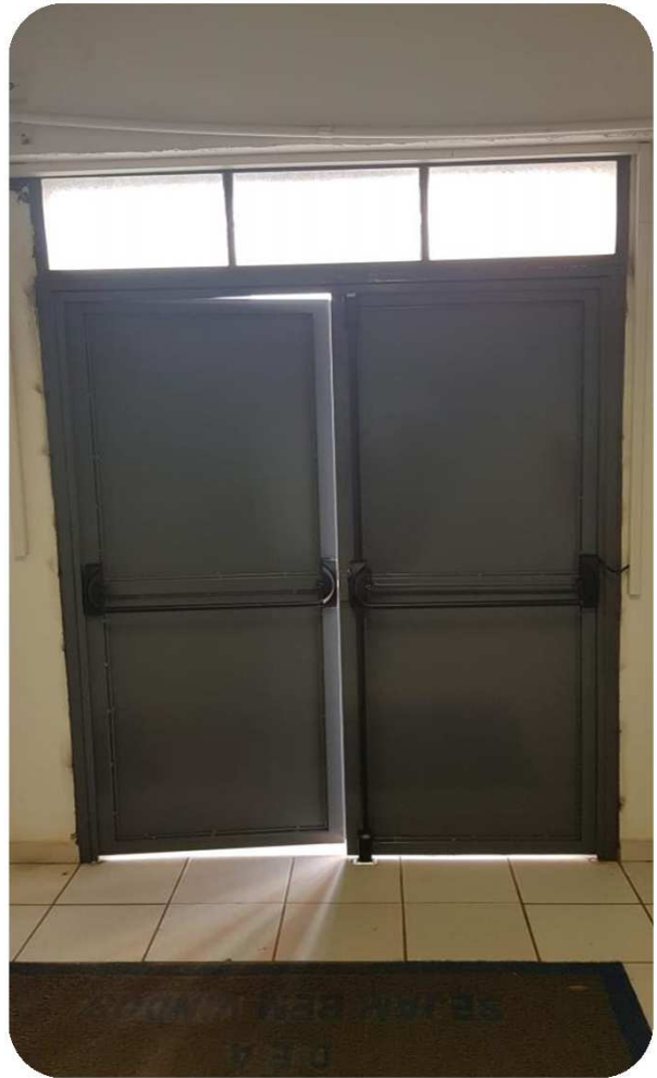
FOTO 3 E 4: FOTO DA PARTE EXTERNA E INTERNA DA PORTA INSTALADA NO PRÉDIO DA PLANTA PILOTO DO DEPARTAMENTO DE ENGENHARIA DE ALIMENTOS - DEA.