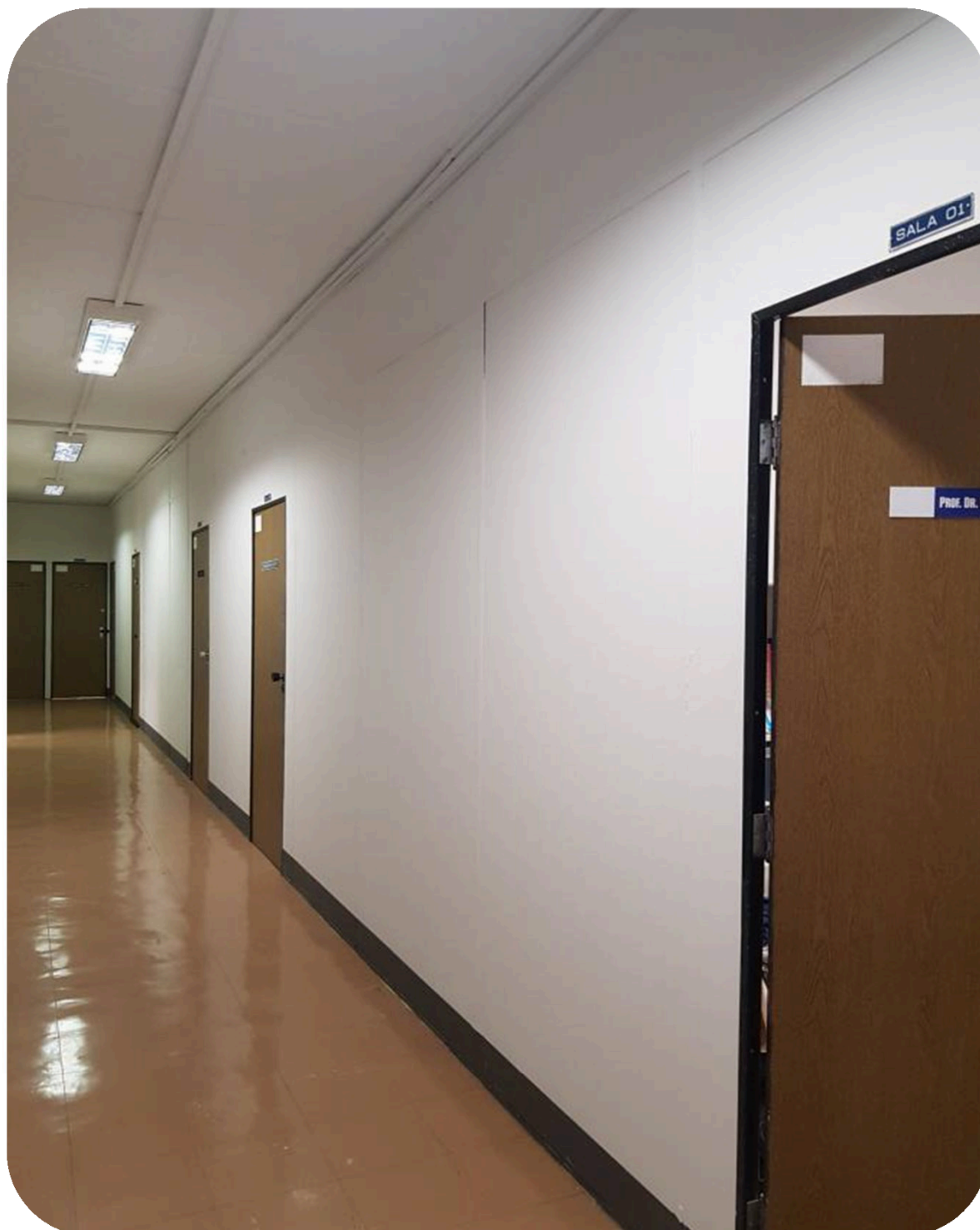
FOTO 2: Em destaque na foto o corredor do prédio de Professores do DEA/DETA após a reforma. A reforma compreendeu a alteração de layout de várias salas, com instalação de divisórias acústicas, para atender a demanda pedagógica atual. Também foi executado pintura e foi reformada toda a infraestrutura elétrica e de dados.