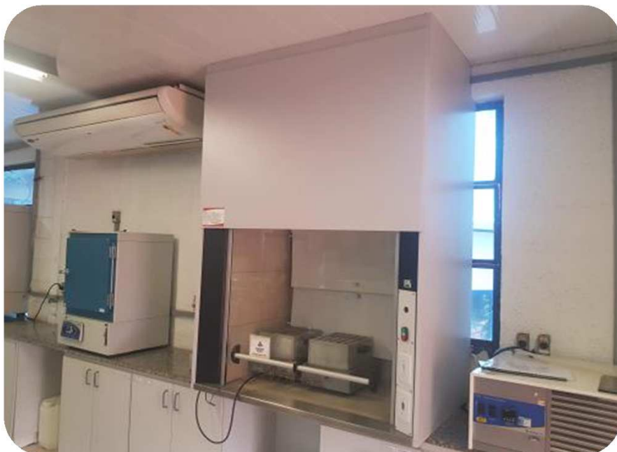
FOTOS 1: DETALHE DA NOVA CAPELA - PREPARADA PARA DIGESTÃO DE PROTEÍNAS.